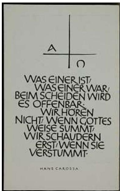
Die Verse des 1956 in Passau-Rittsteig verstorbenen Dichters Hans Carossa sind seit Jahrzehnten auf vielen Sterbebildern abgedruckt.

Ab 1875 sind die ersten Sterbebilder mit Fotografien der Verstorbenen nachweisbar. Die Fotos wurden aber nicht aufgedruckt,